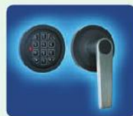
b) EL Elektronisches Sicherheitsschloss inkl. 9 Volt Blockbatterie.