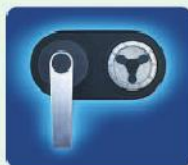
a) MC Mechanisches Zahlenkombinationsschloss