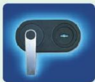
Standardschloss DB Doppelbart Hochsicherheitsschloss